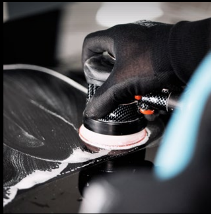
EXTRM FEINES SCHLEIFBILD